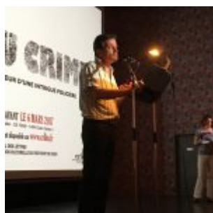
Lecture d'extraits des