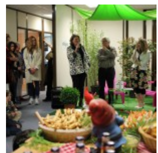
Lancement de la