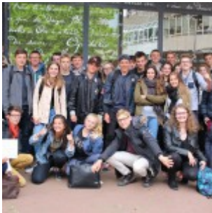
La Seconde 1 du lycée Tocqueville de Cherbourg-en- Cotentin, prix de la meilleure classe