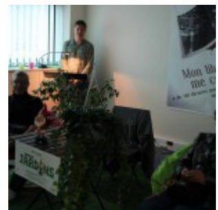
Lectures sensorielles par le comédien Yo du Milieu