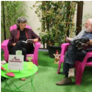
Le CRL reconverti en jardin !