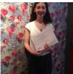
Prix de la meilleure nouvelle