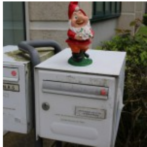
Pour vous rendre à la fête des 10 ans du concours de nouvelles, suivez les nains !