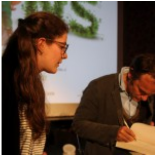
Timothée de Fombelle, président d'honneur du prix lycéen