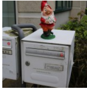
Pour vous rendre à la fête des 10 ans du concours de nouvelles, suivez les nains !