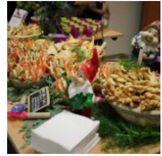
Buffet végétal proposé par Greedy Guts