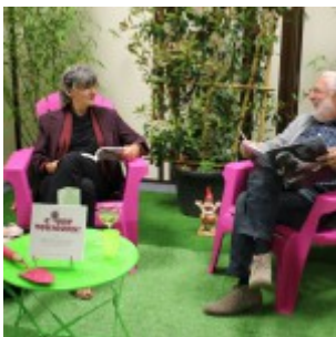
Le CRL reconverti en jardin !