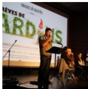
Le comédien Yo du Milieu lisant quelques extraits des nouvelles lauréates