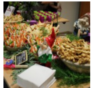
Buffet végétal proposé par Greedy Guts