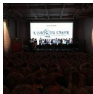
Remise des prix du