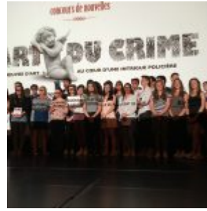
Prix de la classe, Lycée Victor Hugo (Caen).