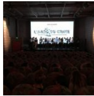
Remise des prix du Concours de nouvelles du CRL 2017 au Café des Images.