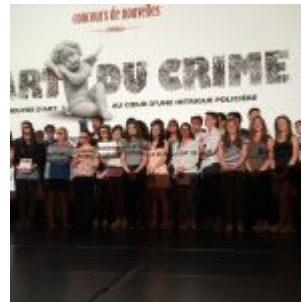
Prix de la classe, Lycée Victor Hugo (Caen).