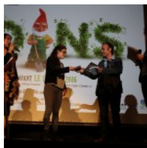
Remise du prix de