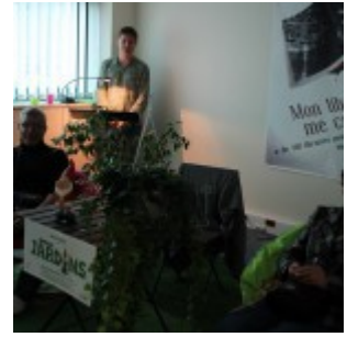
Lectures sensorielles par le comédien Yo du Milieu