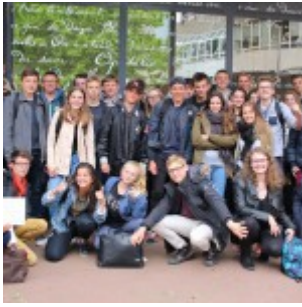
La Seconde 1 du lycée Tocqueville de Cherbourg-en-Cotentin, prix de la meilleure classe