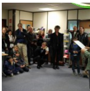
Le comédien Yo du Milieu lisant un