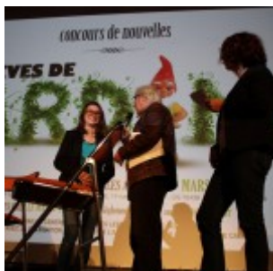
Remise du prix de