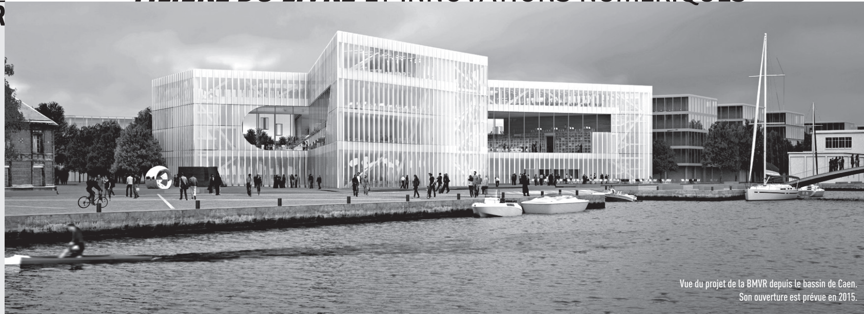
Vue du projet de la BMVR depuis le bassin de Caen. Son ouverture est prévue en 2015.