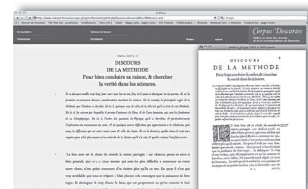
Le projet Corpus Descartes est abrité par le Pôle du document numérique, créé par la MRSH et dédié à la valorisation numérique du patrimoine et de la recherche.