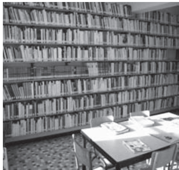
La bibliothèque du Centre pénitentiaire de Caen. La Basse-Normandie compte 5 établissements pénitentiaires : une maison d'arrêt à Caen, Coutances et Cherbourg-Octeville, un centre de détention à Argentan et un centre pénitentiaire à Caen.